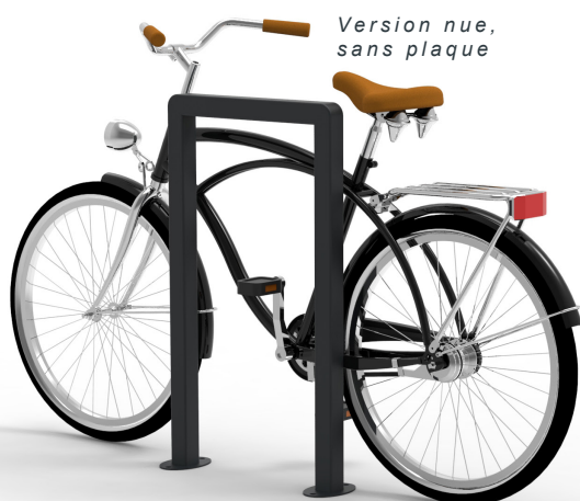
Version nue, sans plaque