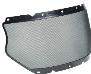
10155775- Ecran grillage avec option mentonnière