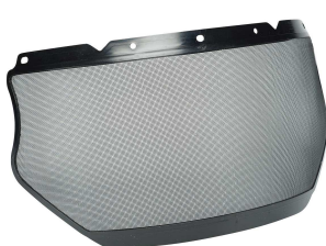
10155774- Ecran grillagé