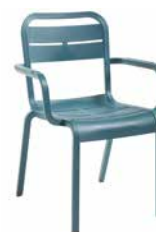
Bleu Minéral U7 701 784