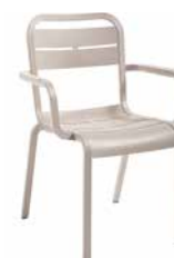
Havane U7 701 011