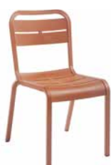
Terracotta U7 601 814