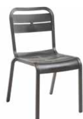
Anthracite U7 601 002