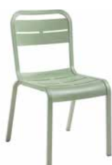
Vert Tender U7 601 736