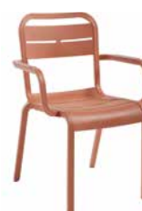
Terracotta U7 701 814