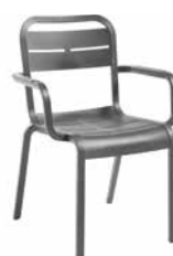
Anthracite U7 701 002