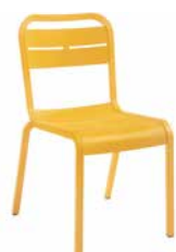
Jaune Indien U7 601 737