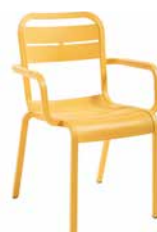
Jaune Indien U7 701 737