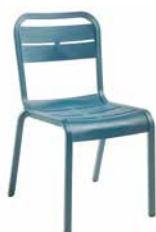
Bleu Minéral U7 601 784