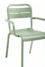
Vert Tender U7 701 736