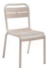
Havane U7 601 011