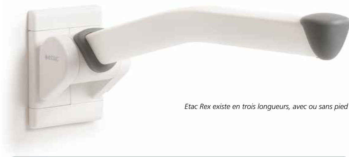
Etac Rex existe en trois longueurs, avec ou sans pied d'appui.

L'accoudoir Etac Rex se fixe facilement au mur et se fond dans le décor de votre salle de bain.