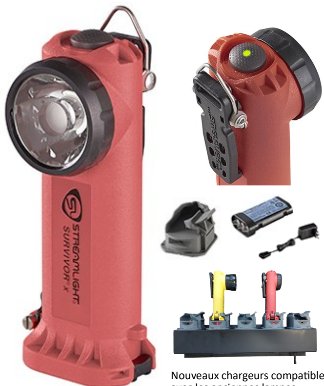
Nouveaux chargeurs compatible avec les anciennes lampes

La nouvelle lampe SURVIVOR X ATEX est conçue pour répondre aux attentes des pompiers dans les zones les plus dangereuses. Elle est équipée d'une puissante pince pour l'accrocher solidement à votre équipement, d'un anneau et d'un bouton adapté aux gants qui dispose d'un indicateur d'autonomie.