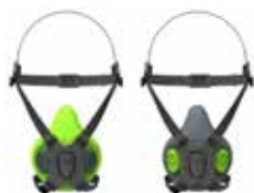
Respirateurs à demi-masque BLS 4000 S - BLS 4000R