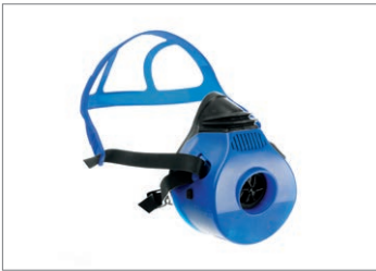
Dräger X-plore® 4740, silicone

La famille Dräger X-plore 4700 est un demi-masque robuste et durable conçu pour résister aux conditions les plus difficiles. Il est aussi équipé d'un jeu de brides Flexifit pour une pose et un retrait faciles ainsi que pour une tenue confortable.