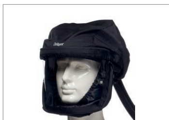
Ecran de protection Dräger X-plore® 8000

Les casques X-plore 8000 de Dräger avec visières et écrans de protection rendent le travail industriel le plus ardu bien plus facile en ajoutant une protection des yeux et de la tête (casque avec visière seulement), comme des solutions intégrées à la protection respiratoire.