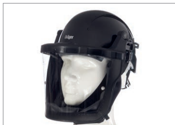
Casque avec visière Dräger X-plore® 8000