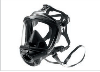
Dräger FPS® 7000, masque complet

Les masques Dräger X-plore 6300, 6530, 6570 et Dräger FPS 7000 définissent de nouveaux standards de sécurité et de confort. Ces masques complets vous apportent le plus haut niveau de protection (TM3) basé sur une étanchéité fiable grâce à un joint double qui s'adapte au visage.