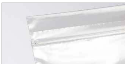
Fermeture avec témoin d'intégrité