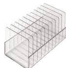
Rack 10 places

Broyeur à double action de malaxage et d'agitation pour l'homogénéisation des échantillons directement dans des sachets stériles. Le fond rond des sachets, combiné à la forme de ses pales circulaires, assure une récupération optimale des cellules et organismes contenus dans les échantillons à traiter.