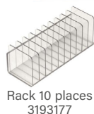
Rack 10 places 3193177