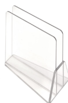
Rack 1 place