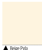
▲ Beige Pyla