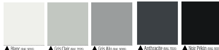
▲ Blanc (RAL 9016) ▲ Gris Clair (RAL 7035) ▲ Gris Alu (RAL 9006) ▲ Anthracite (RAL 7016) ▲ Noir Pékin (RAL 9005)