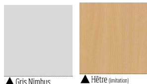
▲ Gris Nimbus ▲ Hêtre (imitation)