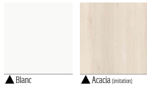
▲ Blanc ▲ Acacia (imitation)