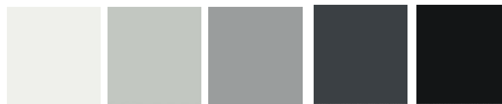
▲ Blanc (RAL 9016) ▲ Gris Clair (RAL 7035) ▲ Gris Alu (RAL 9006) ▲ Anthracite (RAL 7016) ▲ Noir Pékin (RAL 9005)