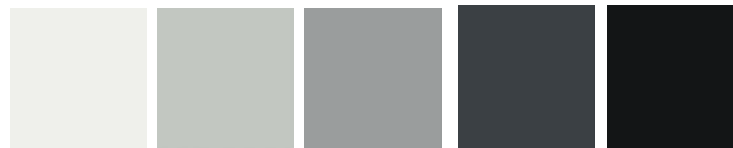
▲ Blanc (RAL 9016) ▲ Gris Clair (RAL 7035) ▲ Gris Alu (RAL 9006) ▲ Anthracite (RAL 7016) ▲ Noir Pékin (RAL 9005)