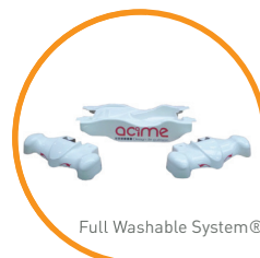
Full Washable System®