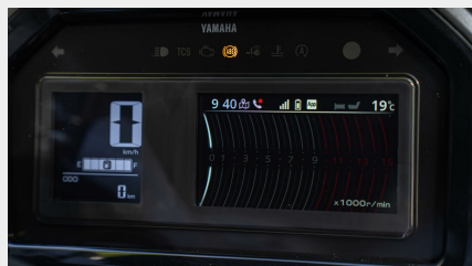
Tableau de bord TFT couleur de 4,2 pouces

Outre ses caractéristiques haut de gamme et son style raffiné, le XMAX 125 Tech MAX+ propose aussi des coloris dédiés qui renforcent sa position de scooter sportif haut de gamme. Que vous le choisissiez en Ceramic Grey ou en Dark Magma, vous pouvez être sûr que votre nouveau Tech MAX+ vous procurera un sentiment de bien-être et de fierté lors de tous vos déplacements.