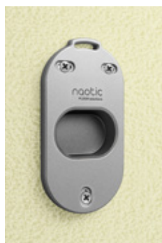
Base accrochée au mur