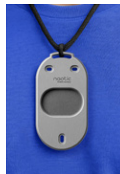
Base portée autour du cou