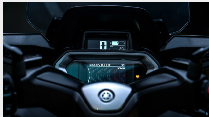
Tableau de bord TFT couleur de 4,2 pouces

Le tout nouveau tableau de bord est doté d'un écran TFT couleur de 4,2 pouces qui offre des fonctionnalités accrues. Un compteur de vitesse LCD séparé de 3,2 pouces est situé au-dessus de l'écran principal. À l'aide des commutateurs situés sur la partie gauche du guidon, vous pouvez sélectionner les écrans et fonctionnalités, de quoi enrichir le plaisir de vos trajets.