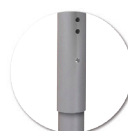
Système de réglage en hauteur