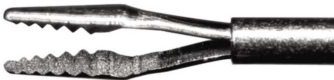
805.47 : Pince Reflex Dentelée 25G+