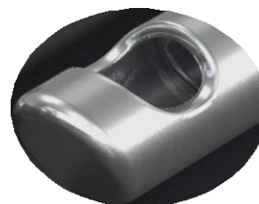
Sonde Vitrectomie Ultravit 10 000 cpm 27+G Constellation